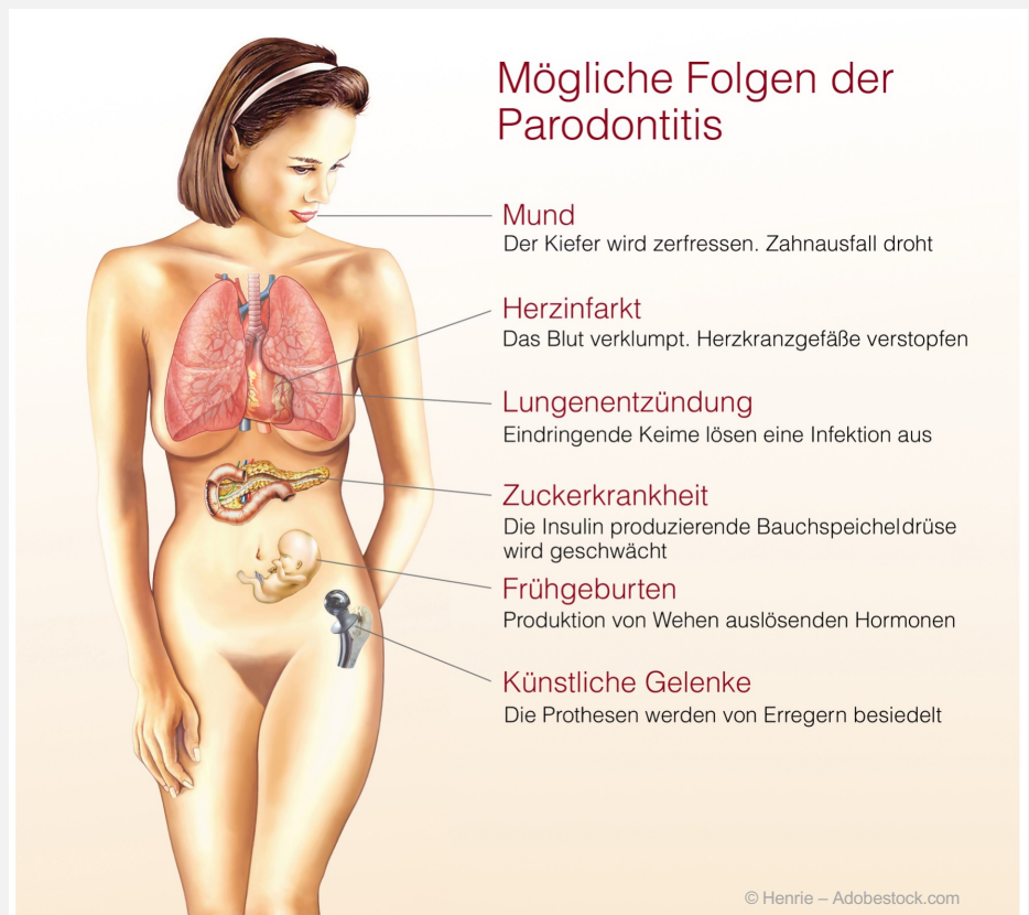
Übersicht über die möglichen Krankheiten, die durch eine Parodontitis hervorgerufen werden können