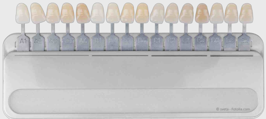
Farbskala zur Bleaching-Kontrolle

Wenn wir es machen, um mehrere Farbstufen . Das kann man ziemlich genau mit einer sog. Farbskala messen (siehe Foto). Frei verkäufliche Aufheller aus dem Internet oder Drogeriemarkt schaffen das meistens nicht.