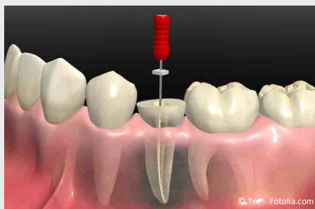
Wurzelbehandlung eines zerstörten Zahnes

Wurzelbehandlungen werden meistens mit Betäubung durchgeführt. Deshalb sind sie in aller Regel nicht schmerzhaft . In seltenen Fällen (wenn ein Zahnerv sehr stark entzündet ist), können trotz Betäubung während der Behandlung vorübergehend Schmerzen auftreten.