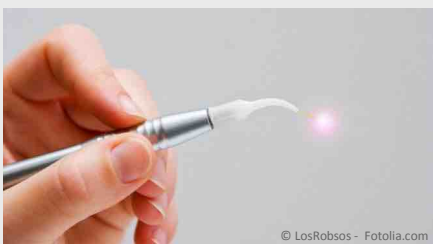
Laser: Gebündeltes Licht

Das ist aber noch nicht alles: Die Wundheilungszeit verkürzt sich ebenfalls. Das bedeutet, dass Sie weniger Nachschmerzen haben und wieder schneller fit sind. Außer für operative Eingriffe am Zahnfleisch können Dioden-Laser noch für viele andere Zwecke vorteilhaft genutzt werden. Welche das sind, erfahren Sie im Folgenden: