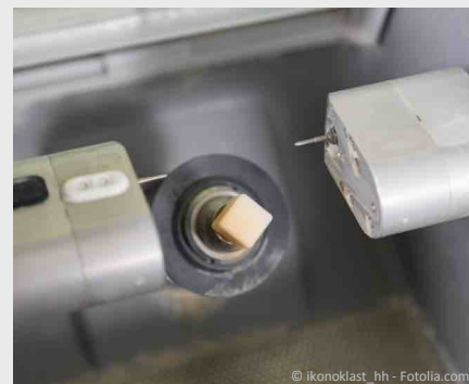
Das Inlay wird innerhalb weniger Minuten aus einem Keramik-Block gefräst.

Diese Technik spart nicht nur Zeit, sondern auch Geld: Weil kein Abdruck, kein Provisorium, kein Zahntechniker und kein zweiter Termin notwendig sind, können solche Inlays preisgünstiger angefertigt werden.