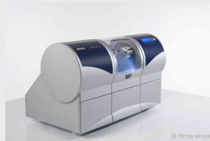
Schleifgerät für Inlays, Kronen und Brücken aus Keramik

Diese Inlays sind sehr stabil, bewährt und haltbar. Untersuchungen zeigen, dass sie so lange wie Gold-Inlays halten. Seit 1985 wurden mit dieser Methode weltweit über 20 Millionen Keramik-Inlays hergestellt und eingesetzt.